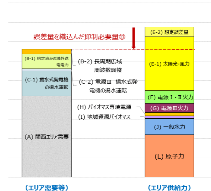
再エネの出力抑制を行う必要性と抑制必要量